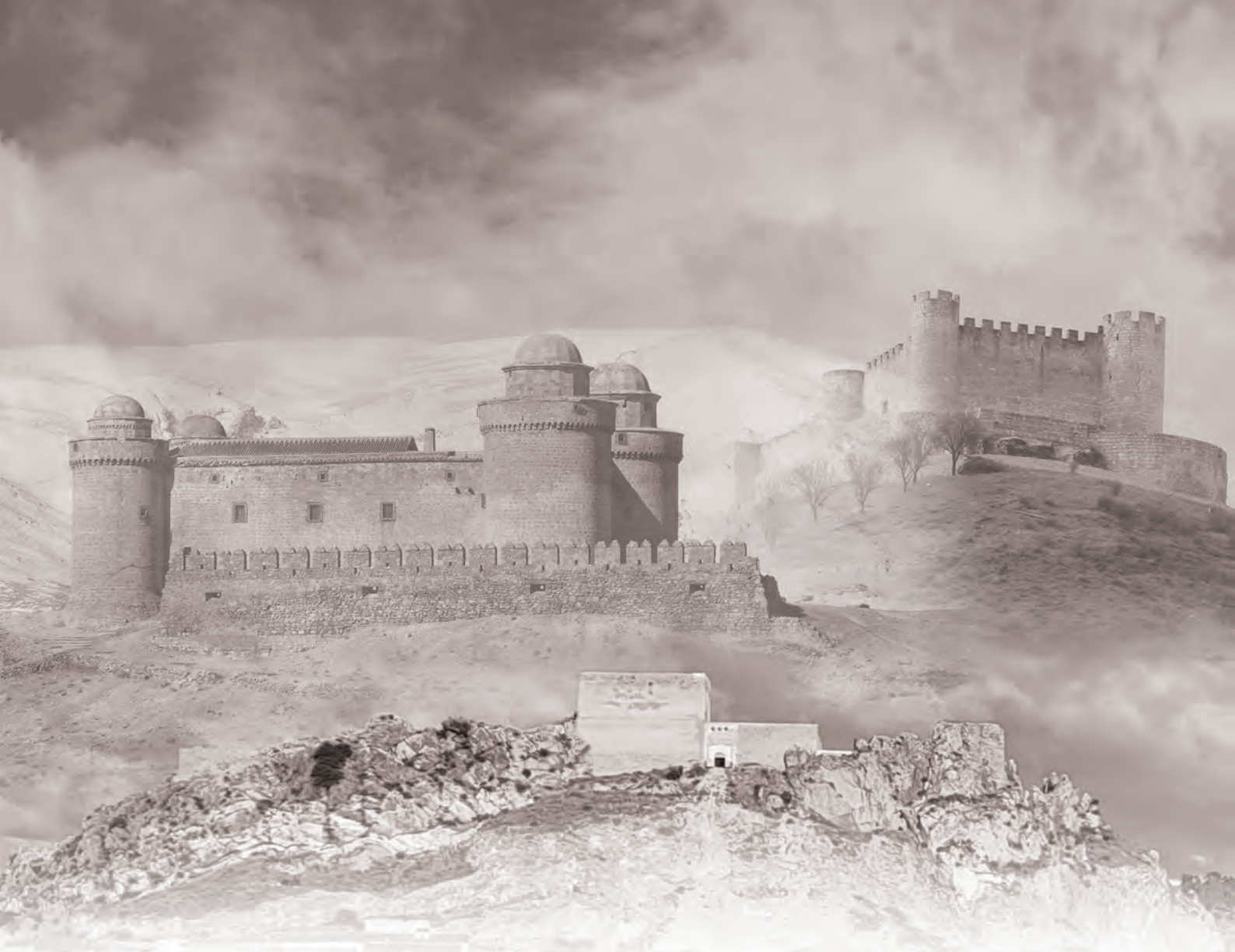
Imagen: Castillos de Ayora, la Calahorra y Jadraque.