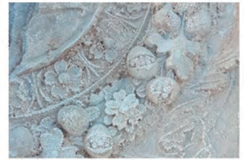
Imágenes del retablo de San Miguel de Yáñez de la Almedina y de las molduras y losetas del Castillo de Ayora.